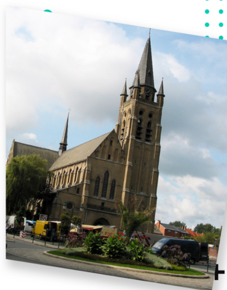
Localisation de Comines-Warneton

Elle est dans l'arrondissement de Tournai-Mouscron, mais a la spécificité territoriale d'être enclavée entre la France et la Région flamande. Cette exclave wallonne est séparée du reste du Hainaut par une vingtaine de kilomètres.